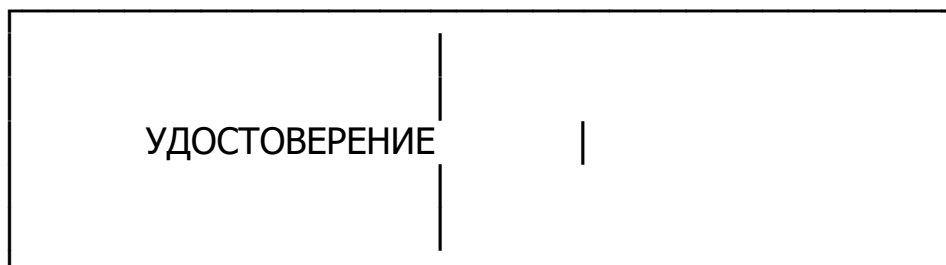
Внутренние левая и правая стороны бланка удостоверения